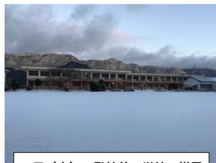
5日（水）の登校前の学校の様子

現在アンケート結果を集計中で、その結果については、校長室通信でお知らせできればと思います。タブレットのアンケート項目を読みながら、真剣に回答している子供たちの姿を見て、改めて今年度の学校生活の総括について、そして次年度の学校づくりについて、子供の視点で考えることの重要性を再認識したところです。