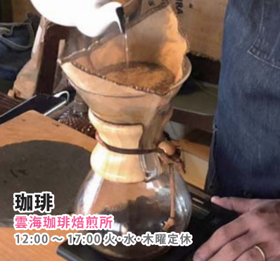
珈琲 雲海珈琲焙煎所 12:00~17:00 火・水・木曜定休