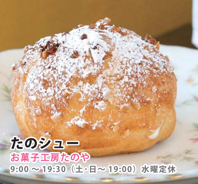
たのシュー お菓子工房たのや 9:00~19:30 (土・日~19:00) 水曜定休