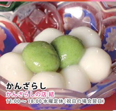
かんざらし かんざらしの店 結 11:00~18:00 水曜定休 (祝日の場合翌日)