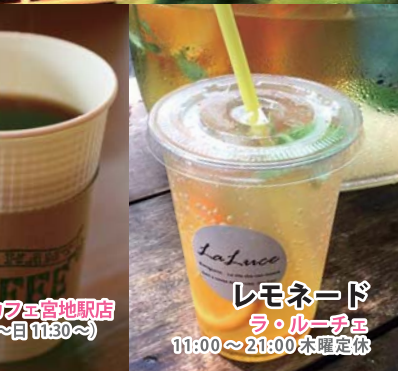
珈琲 エレファントカフェ 富地駅前店 11:00~18:30 (金~日11:30~) 木曜定休 レモネード ラ・ルーチェ 11:00~21:00 水曜定休