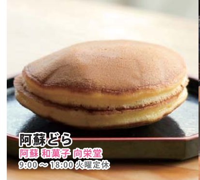
阿蘇どら 阿蘇和菓子 向栄堂 9:00~18:00 火曜定休