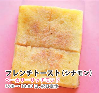
フレンチトースト (シナモン) ペーカリーリッチモンド 7:00~19:00 日・祝日定休