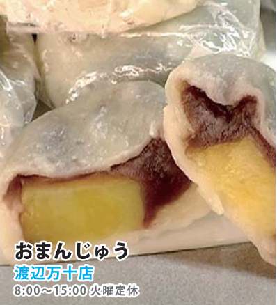
おまんじゅう 渡辺万十店 8:00~15:00 火曜定休