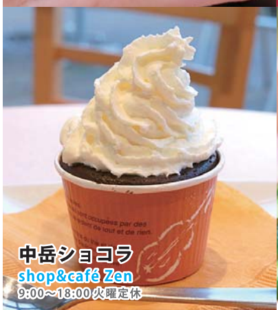
中岳シヨヨラ shop&café Zen 9:00~18:00 火曜定休