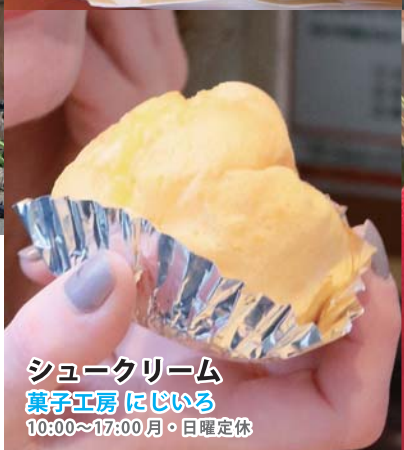
シュークリーム 菓子工房 にじいる 10:00~17:00 月・日曜定休