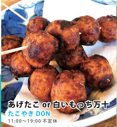
あげたこ or 白いもつち万十 たこやき DON 11:00~19:00 不定休

ご予約・お問い合わせ ASO CYCLE & CLIMBING BASE CLAMP クランプ 阿蘇サイクル&クライミングベース ☎ 0967-32-0928 阿蘇市内牧 48 9:00~17:00 (11月~2月は10:00~) 木曜定休