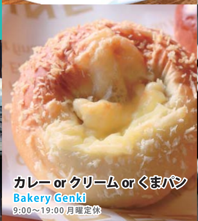
カレー or クリーム or くまパン Bakery Genki 9:00~19:00 月曜定休