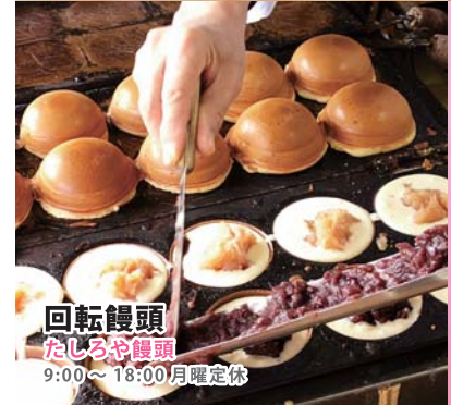
回転饅頭 たしるや饅頭 9:00~18:00 月曜定休