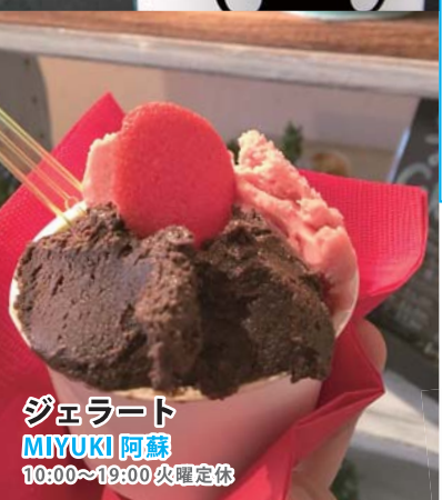
ジェラート MIYUKI 阿蘇 10:00~19:00 火曜定休