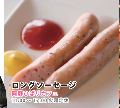
ロングソーセージ 阿蘇ひばりカフェ 11:00~17:00 火曜定休