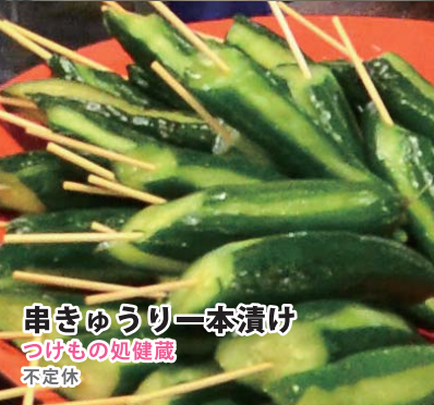
串きゅうり一本漬 つげもの処 健蔵 不定休