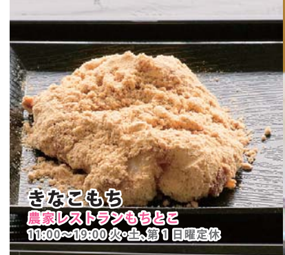
きなこもち 農家レストランももと 11:00~19:00 火・土、第1日曜定休