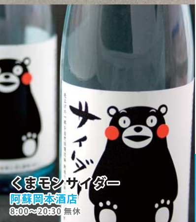
くまモンサイダー 阿蘇阿本酒店 8:00~20:30 無休