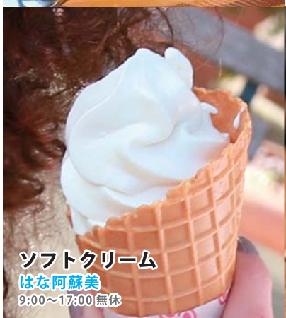
ソフトクリーム はな阿蘇美 9:00~17:00 無休