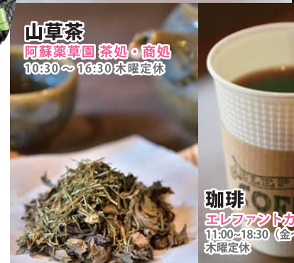
山草茶 阿蘇薬草園 茶処・商処 10:30~16:30 木曜定休