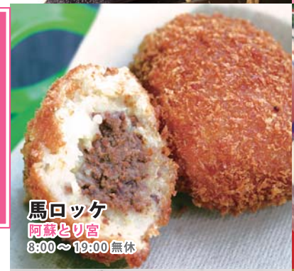
馬ロッケ 阿蘇とり宮 8:00~19:00 無休