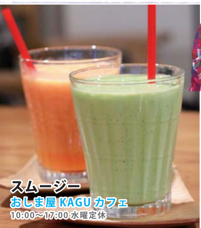
スムージー おしま屋 KAGU カフェ 10:00~17:00 水曜定休