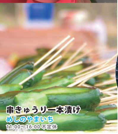
串きゅうり一本漬 めしのやまいち 11:00~16:00 不定休